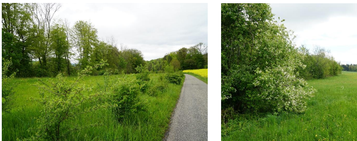
Abb. 3 Links: neu gepflanzte, artenreiche Hecke im Chapf, rechts: artenreiches Ufergehölz entlang des Grossmattbachs