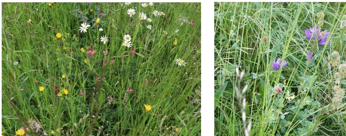
Abb. 2 Links: blütenreiche Fromentalwiese, rechts: Halbtrockenrasen mit Gewöhnlicher Knäuel-Glockenblume