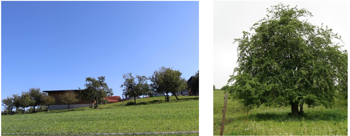
Abb. 4 Links: erhaltener Hochstamm-Feldobstgarten in Friedlisberg, rechts: alter, ökologisch sehr wertvoller Weissdorn